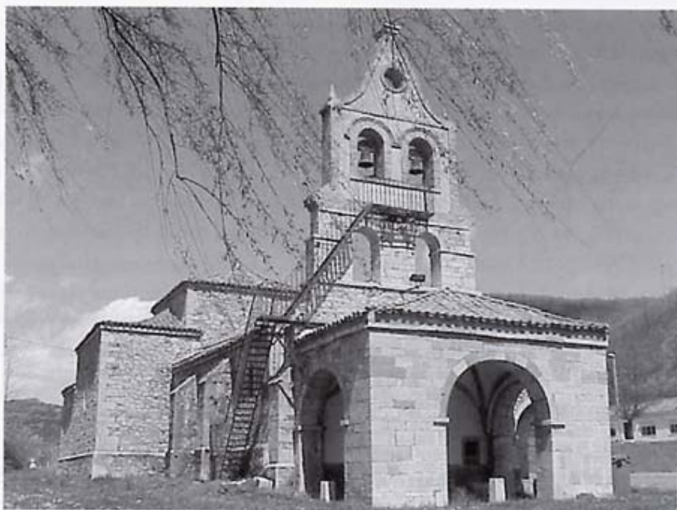
Santuario del Buen Suceso de Gordón. Vista Sur