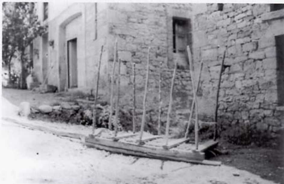
Forcao de Gordón. Archivo Fotográfico del Instituto Leonés de Cultura