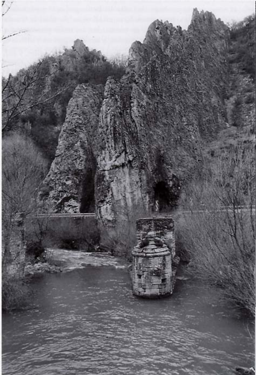
Restos del puente de "Las Viescas" en Vega de Gordón (2004)