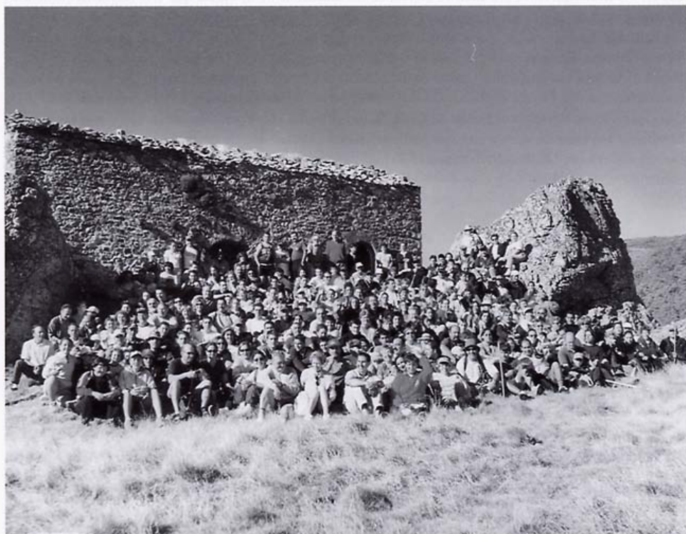
San Lorenzo de La Gotera 2001